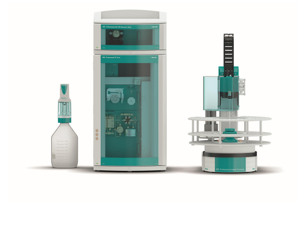
Figure 1. Configuración instrumental que incluye un 940 Professional IC Vario (centro), un 947 Professional UV/VIS Detector Vario SW (arriba, centro), un 858 Professional Sample Processor (derecha) y MiPCT-ME, realizado con el Metrosep A PCC 2 HC/4.0 y un Dosino (izquierda).

Después de la inyección, los componentes aniónicos se separaron isocráticamente en 45 minutos en un Metrosep A Supp 10 - columna 250/4.0. La señal del detector UV/VIS se registró a 215 nm. La confirmación de la precisión del método se realizó con un estudio de adición. A la muestra se le añadió un estándar de nitrito a dos niveles de concentración (1,0 µg/l y 4 µg/l) y se evaluaron los valores de recuperación.