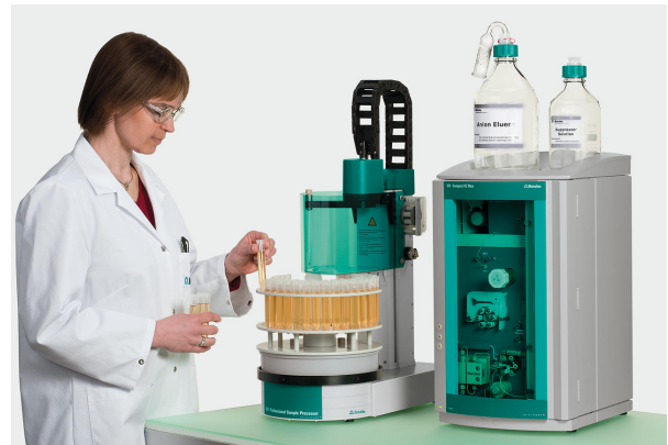
Figure 1. Instrumentación Metrohm IC compacta y fácil de usar para cuantificar oxihaluros, además de aniones estándar, en agua potable.

Las muestras de agua analizadas contenían altas concentraciones (en el rango de mg/L) de cloruro (9-11 mg/L), sulfato (5-14 mg/L) y nitrato (4-9 mg/L) (Tabla 1, Tabla 2 y Figura 2). Se detectaron bromuro y fluoruro en concentraciones menores (<0,006 mg/L y <0,07 mg/L, respectivamente), mientras que los subproductos tóxicos de la desinfección, clorato, bromato y clorito, así como el nitrito, no se detectaron