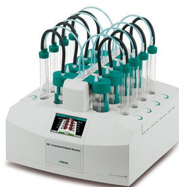
Figure 1. 893 Biodiesel Profesional Rancimat equipado con recipientes de medición y reacción para la determinación de la estabilidad a la oxidación del biodiesel.

La conductividad de la solución de medición se registra continuamente. La formación de productos de oxidación secundarios conduce a una mayor conductividad de la solución. Un buen indicador de la estabilidad a la oxidación, el «tiempo de inducción», es el tiempo hasta que se produce este marcado aumento de conductividad (Figura 2).