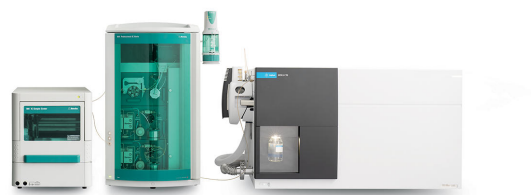
Figura 1. Configuración instrumental para medir ácidos haloacéticos, dalapón y bromato, incluyendo un Centro de Muestras IC 889 – cool (Metrohm), un IC Vario 940 Professional (Metrohm) y un LC/MS de Triple Cuadрупolo 6475 con Fuente de Iones Jet Stream Technology (Agilent). Se utilizó un Dosino para la infusión directa al MS durante la optimización del método.

La combinación de la HPLC con la espectrometría de masas se ha centrado comúnmente en el estudio de moléculas orgánicas. La combinación de la cromatografía iónica (IC) con la espectrometría de masas (EM) abre el campo al análisis de alta sensibilidad de sustancias iónicas y más polares en soluciones acuosas o matrices que contienen sales. El uso del Centro de Muestras 889 IC – cool garantiza un procesamiento de muestras estable y reproducible a 4 °C (Figura 1) al prevenir la desintegración de los HAA sensibles a la degradación.