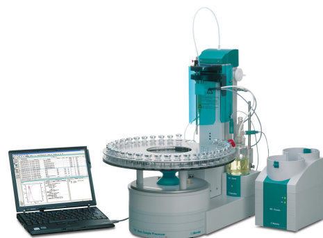
Figure 1. El procesador de muestras de horno 874, el Titrando 851 y la celda de titulación coulométrica, todos controlados por el software tiamo.

Este análisis se lleva a cabo en un sistema automatizado que consta de un procesador de muestras de horno 874 y un Titrando 851 equipado con una celda de titulación coulométrica (Figura 1).