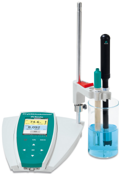
Figure 1. 914 pH/OD/Conductómetro equipado con un O 2 -Lumitrode para la determinación de oxígeno disuelto en jugos.

Este análisis se lleva a cabo en un 914 pH/DO/Conductometer equipado con un O 2 -Lumitrode que está calibrado con 100% y 0% de saturación de aire. La muestra preparada se abre cuidadosamente y el O 2 -Lumitrode se coloca directamente en la muestra. Se inicia la medición y se muestra el contenido de DO medida hasta alcanzar un valor estable. Posteriormente, se retira el sensor y se enjuaga bien con agua desionizada. Si es necesario, seque. Para cada análisis, se abre una nueva botella de muestra. El sensor se almacena seco con un recipiente de calibración montado para su protección.