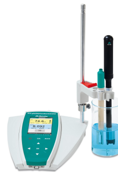
Figure 1. 914 pH/OD/Conductómetro equipado con un O 2 -Lumitrode para la determinación de oxígeno disuelto en jugos.

La muestra preparada se abre cuidadosamente y el O 2 -Lumitrode se coloca directamente en la muestra. Se inicia la medición y se muestra el contenido de DO medida hasta alcanzar un valor estable. Posteriormente, se retira el sensor y se enjuaga bien con agua desionizada. Si es necesario, seque. Para cada análisis, se abre una nueva botella de muestra. El sensor se almacena seco con un recipiente de calibración montado para su protección.