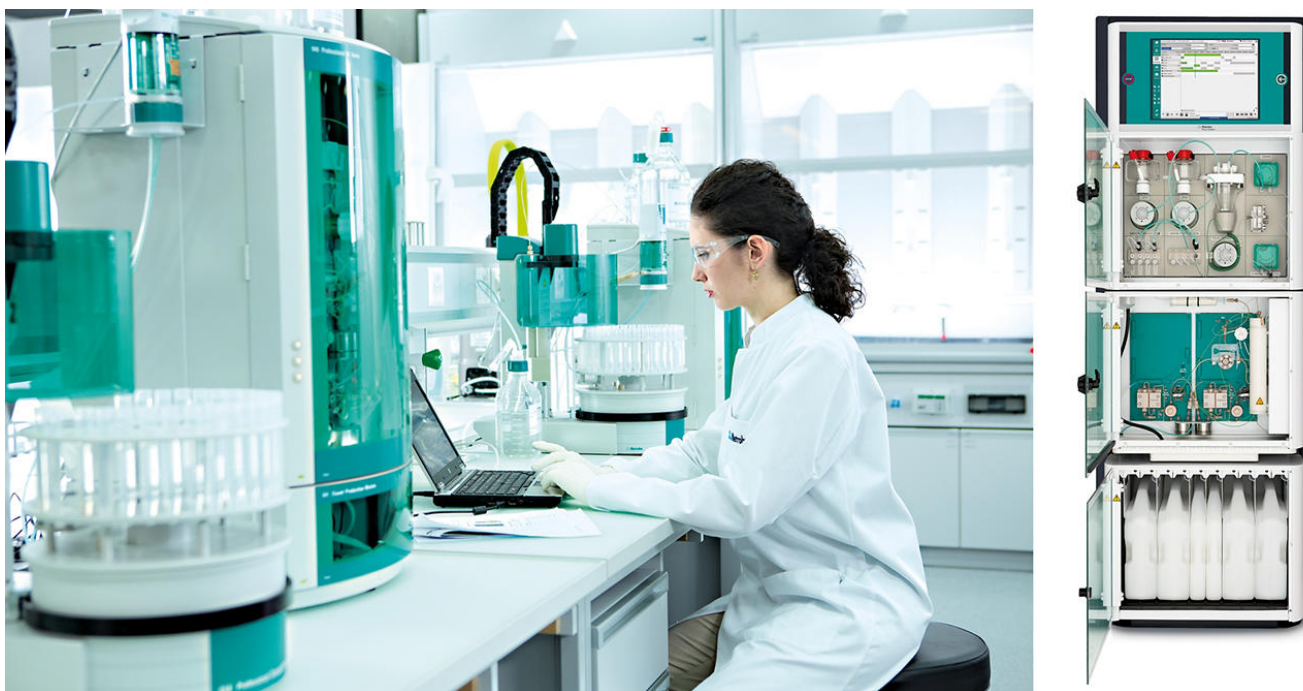
Figure 2. Cromatógrafos iónicos para laboratorios (izquierda) y para análisis de procesos (derecha).