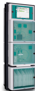
Figure 2. 2060 Process Analyzer de Metrohm para la monitorización en línea del peróxido de hidrógeno durante el proceso CMP.

Se pueden realizar otras combinaciones de mediciones, así como puntos de medición tomados de un solo flujo de proceso o incluso de varios flujos, en toda la cartera de productos de Metrohm Process Analytics. Todas las plataformas garantizan resultados rápidos y precisos continuamente disponibles para un verdadero control del proceso.