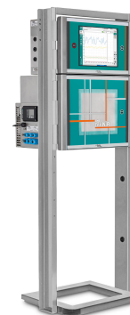
Figure 2. El analizador NIR-Ex 2060 de Metrohm Process Analytics es adecuado para su uso en áreas peligrosas.

Metrohm Process Analytics fabrica analizadores de procesos NIRS que recopilan datos espectrales del proceso en «tiempo real». Se utilizan para comparar con un método primario (p. ej., titulación Karl Fischer) para crear un modelo simple pero indispensable para monitorear fácilmente los parámetros de control de calidad casi en tiempo real. Obtenga más control sobre el proceso de refinación con una 2060 E/ Analizador NIR-Ex configurado para aplicaciones en zonas ATEX ( Figura 2 ). Este analizador de procesos es capaz de monitorear hasta cinco puntos de muestra por gabinete NIR con la opción de multiplexor.