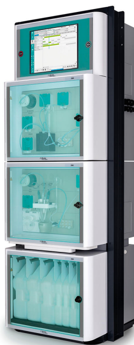
Figure 3. 2060 TI Process Analyzer de Metrohm Process Analytics.