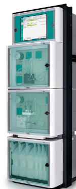
Figure 2. 2060 Process Analyzer para mediciones fotométricas de ultratrazas de hierro y cobre en el circuito agua-vapor de centrales eléctricas.

El análisis continuo de ultratrazas en línea de Fe y Cu en el circuito de agua-vapor de las centrales eléctricas es posible utilizando el Analizador de procesos 2060 (Figura 2) de Metrohm Process Analytics. Este sistema automatizado de análisis de procesos permite la detección temprana de picos y procesos de corrosión, y también monitorea la formación y destrucción de la capa protectora de óxido (figura 3). Los análisis continuos también señalan un problema antes de que los metales disueltos puedan llegar a la corriente de condensado y, por lo tanto, a las palas de la turbina, donde podrían causar daños. En combinación con el Sistema de control distribuido (DCS) de la planta de energía, el monitoreo en línea de Fe y Cu garantiza que la corrosión se pueda controlar antes de que afecte la eficiencia de la planta de energía, lo que en última instancia reduce el tiempo de inactividad y los costos de mantenimiento.