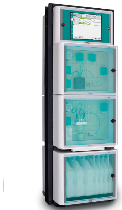
Figura 2. 2060 TI Process Analyzer utilizado para el monitoreo en línea de peróxido de hidrógeno en baños de desparasitación de salmón.