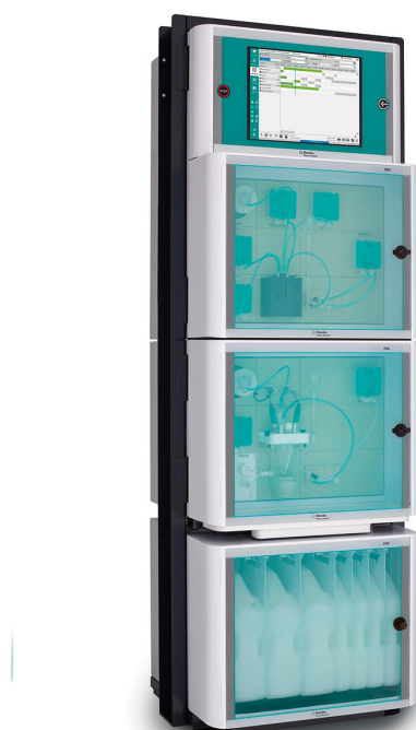
Figure 2. 2060 TI Process Analyzer para el análisis en línea de parámetros críticos de calidad en baños de decapado mediante el método de valoración.

productos químicos se reducen considerablemente. Metrohm Process Analytics ofrece un analizador de procesos multiparamétrico adecuado para el análisis simultáneo de \text{Fe}^{2+}/\text{Fe}^{3+} y de la relación ácido libre/ácido total en un amplio rango de concentraciones: el analizador de procesos 2060 TI (figura 2).