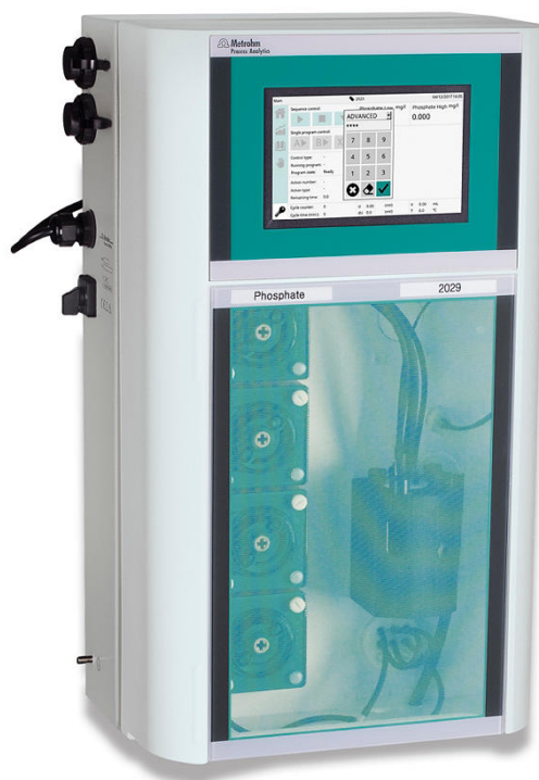
Figure 2. 2029 Fotómetro de proceso.