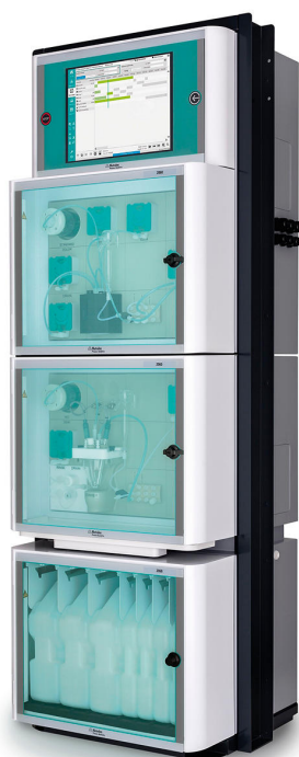
Figure 3. Analizador de procesos 2060 TI.