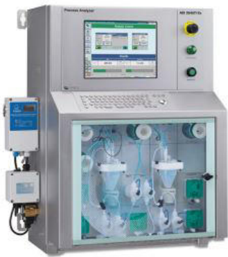
Figure 2. ADI 2045TI Ex proof (ATEX) Analyzer.

El cloruro se analiza con detección de conductividad como se describe en ASTM D3230 con el analizador a prueba de explosiones ADI 2045TI (Figura 2).