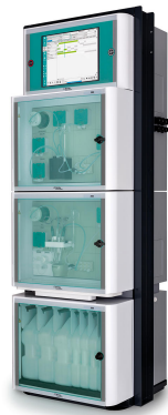
Figure 2. El analizador de procesos 2060 TI es adecuado para monitorear varios parámetros críticos en reactores nucleares de agua presurizada.

Otras aplicaciones de proceso relacionadas con los circuitos de agua de los productores de energía incluyen sílice, sodio, níquel, zinc, calcio, magnesio y cloruro. Con el analizador de procesos 2060 TI de Metrohm Process Analytics es posible realizar mediciones fiables de estos parámetros críticos. (Figura 2).