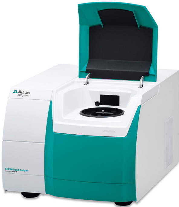
Figure 1. Analizador de líquidos Metrohm DS2500 utilizado para la determinación del número de octano de investigación (RON) en muestras de isomeratos.