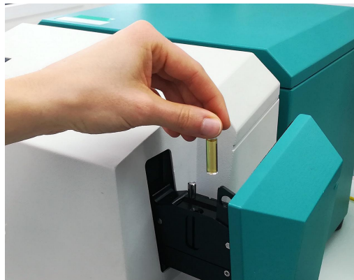
Figure 1. XDS RapidLiquid Analyzer y una muestra de isocianato presente en el vial desechable de 8 mm.

Con no se necesita preparación de muestras , la espectroscopia Vis-NIR permite el análisis de isocianatos en menos de un minuto .