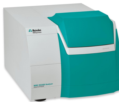
Figure 1. Analizador de sólidos DS2500

Varias láminas de PVC de 250 \mu\text{m} recubiertas con una capa de PVDC de espesor variable (40 \text{g}/\text{m}^2 , 60 \text{g}/\text{m}^2 , 90 \text{g}/\text{m}^2 ) se midieron en el analizador de sólidos DS2500. Las medidas se llevaron a cabo en modo de transflexión utilizando el reflector difuso de oro NIRS con un paso óptico de 1 mm. Esto asegura que la longitud del camino espectral sea constante mientras mejora la señal espectral. El paquete de software Metrohm Vision Air Complete se utilizó para toda la adquisición de datos y el desarrollo del modelo de predicción.