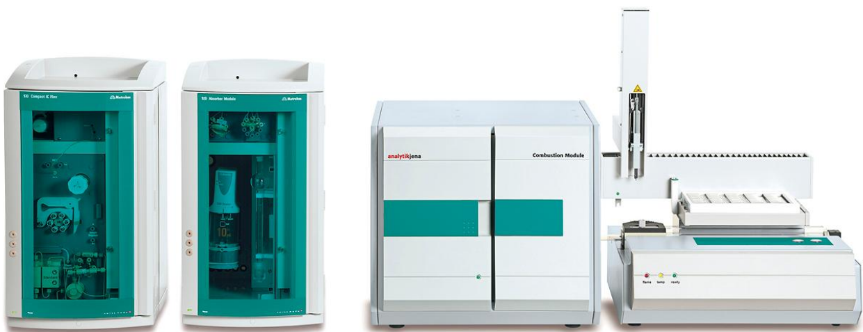
Figura 1. Configuración de IC de combustión que consta de un 930 Compact IC flex (2.930.2560), un módulo de absorción 920 (2.920.0010), un módulo de combustión (horno + ABD, 2.136.0700) y un inyector automático MMS 5000 (2.136.0800) configurado para muestras sólidas (6.7302.000).

consta de un muestreador automático para muestras sólidas, un módulo de combustión, un módulo de absorción y un cromatógrafo de iones (IC) (Figura 1).