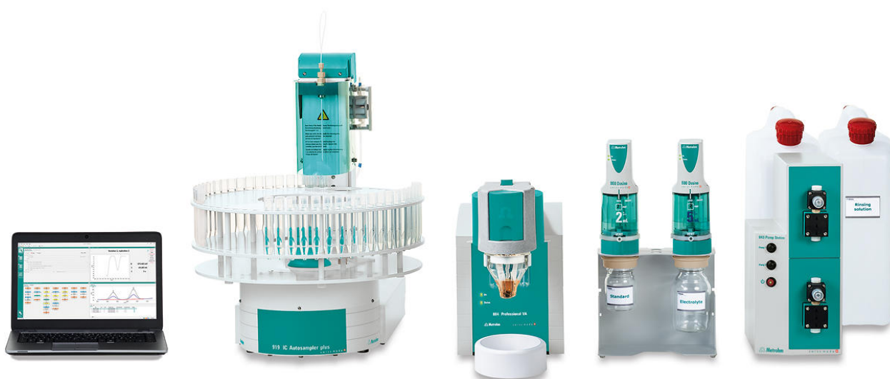
Figure 1. 884 Professional VA, completamente automatizado para el análisis de AV

pipetea en el recipiente de medición. La determinación de cromo(VI) se realiza con el 884 Professional VA utilizando los parámetros especificados en tabla 1 . La concentración se determina mediante dos adiciones de una solución estándar de adición de cromo (VI).