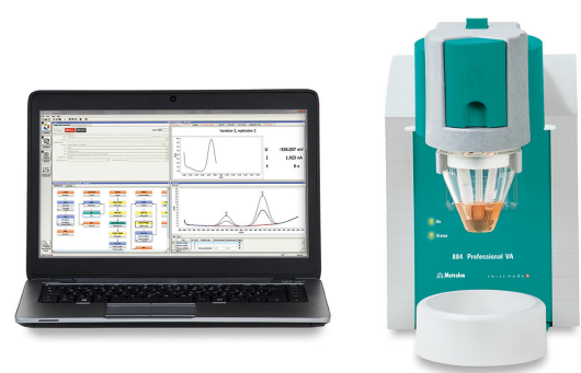
Figure 1. 884 VA profesional.

El contenido de Fe(II) se calcula automáticamente y se almacena en una base de datos junto con todos los parámetros relevantes de determinación y cálculo.