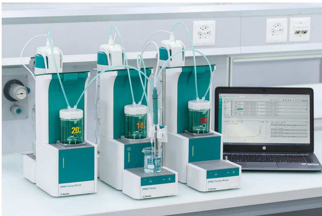
Figura 2. Valorador OMNIS equipado con un electrodo dSolvotrode para la determinación del contenido de cafeína en muestras no acuosas.