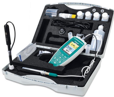
Figure 1. Maletín de transporte que incluye todos los accesorios y un conductómetro/pH/OD 914 equipado con un O 2 -Lumitrodo y un sensor de conductividad para la determinación del oxígeno disuelto en una corriente de agua dulce.

resultados que podrían introducirse por el transporte de la muestra.