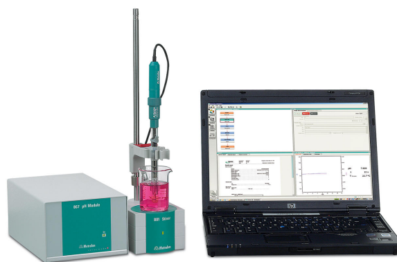
Figure 1. Módulo de pH 867 para una medición de iones precisa y fiable.

A la muestra preparada, se agrega tampón antioxidante de sulfuro y se agita durante 3 minutos para liberar el sulfuro unido. Posteriormente, los sensores se colocan en la muestra y se mide la concentración de sulfuro.