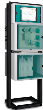
Abbildung 3. 2060 VA Process Analyzer von Metrohm Process Analytics.

Der 2060 VA Process Analyzer ist ein vollautomatisches Analysensystem welches kritische Parameter mittels voltammetrischer Bestimmung ermittelt ( Abbildung 3 ). Er verfügt außerdem über ein Alarmsystem, das das Anlagenpersonal benachrichtigt, wenn eines der überwachten Schwermetalle die Grenzwerte erreicht. Durch diese rechtzeitige Alarmierung können beispielsweise Ionenaustauscher-Regenerationen oder andere Vermeidungsstrategien eingeleitet und Grenzwertüberschreitungen wirksam vermieden werden.