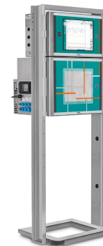
Abbildung 3. Der 2060 The NIR-Ex Analyzer von Metrohm Process Analytics.

Der 2060 The NIR-Ex Analyzer (Abbildung 3) ermöglicht den Vergleich von «Echtzeit»-Spektraldaten aus dem Reforming-Prozess mit einer primären Methode (z. B. Cooperative Fuel Research «CFR»-Tests), um ein einfaches, aber unverzichtbares Kalibriermodell für die OZ-Überwachung zu erstellen. Jeder Metrohm Process Analytics 2060 The NIR-Ex Analyzer ist für Anwendungen in ATEX-Zonen ausgerüstet. Mit einem einzigen Prozessanalysator lassen sich dank der Multiplexer-Option bis zu 5 Messstellen pro NIR-Kabinett überwachen. Eine Erweiterung ist auf bis zu 10 Messstellen mit einer einzigen Auswerteeinheit möglich.