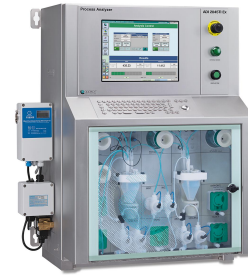
Abbildung 2. Der Ex-geschützte (ATEX) Prozessanalysator ADI 2045TI von Metrohm Process Analytics.

Wasserstoffperoxid wird mithilfe eines Komplexbildners analysiert, gefolgt von einer kolorimetrischen Messung mit einer Tauchsonde.