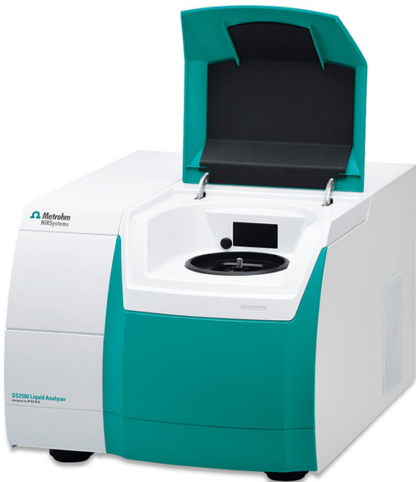
Abbildung 1. Metrohm DS2500 Flüssigkeitsanalysator zur Bestimmung der Research-Oktanzahl (ROZ) in Isomeraten.