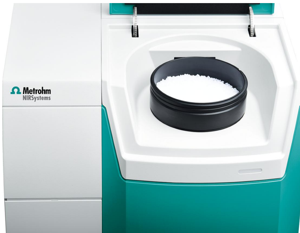
Abbildung 1. Metrohm DS2500 Feststoffanalysator mit einem großen Probenbecher zur Messung der Grenzviskosität von recyceltem Polyethylenterephthalat (rPET).

Dieser Aufbau mit einem großen Probenbecher reduziert den Einfluss der Partikelgrößenverteilung der Polymerpellets ( Abbildung 1 ). Die Datenerfassung und Vorhersagemodellentwicklung wurde mit dem Softwarepaket Vision Air Complete durchgeführt.