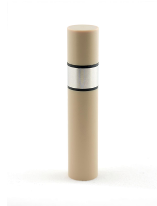
Abbildung 1 Rotierende Zylinderelektrode mit Metalleinsatz, O-Ringe aus Viton (schwarz) und PEEK-Halter.

Inhibitor gelagert. Nach der Aufzeichnung des Leerlaufpotentials (OCP) für fünf Minuten wurden LP-Messungen von -20 mV und +20 mV gegen OCP mit einer Scanrate von 1 \text{ mV s}^{-1} durchgeführt. Bei Korrosionsvorgängen wird das OCP auch als Korrosionspotential, E_{corr} , bezeichnet. Alle Daten wurden mit der NOVA-Software aufgezeichnet und analysiert. Alle Potentiale wurden gegen das Potential der Referenzelektrode aufgezeichnet, d. h. gegen Ag/AgCl 3 mol/L KCl. Die Experimente wurden bei Raumtemperatur durchgeführt.