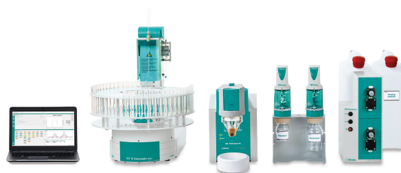
Abbildung 1. 884 Professional VA, vollautomatisch für die VA-Analyse

Die Bi-Tropfenelektrode wird vor der ersten Bestimmung elektrochemisch aktiviert.