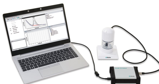
Figure 1. 946 Portable VA Analyzer (scTRACE Gold version)

The scTRACE Gold is electrochemically activated and an ex situ mercury film is deposited prior to the first determination. In the next step, the water sample and the supporting electrolyte are pipetted into the measuring vessel. The determination is carried out with the 884 Professional VA or with the 946 Portable VA Analyzer using the parameters specified in Table 1 . The concentration is determined by two additions of a standard addition solution.