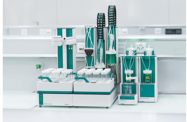
Abbildung 1. OMNIS Sample Robot S, ausgestattet mit einem OMNIS Titrator, einem OMNIS Dosiermodul und einer dSolvotrode für die automatisierte Bestimmung von TAN und TBN in Motorölproben.

gekennzeichnet ist, demonstriert. Es ist keine Probenvorbereitung erforderlich.