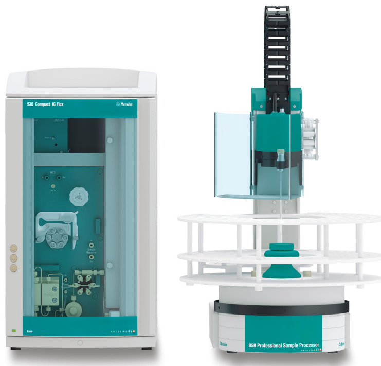
Abbildung 1. Instrumenteller Aufbau mit einem 930 Compact IC Flex Oven/SeS/PP und einem 858 Professional Sample Processor.

zusätzliche Probenvorbereitung ist nicht erforderlich.