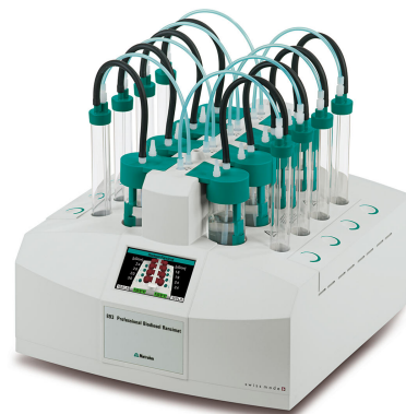
Abbildung 1. 893 Professional Biodiesel Rancimat, ausgestattet mit Mess- und Reaktionsgefäßen, zur Bestimmung der Oxidationsstabilität von Biodiesel.

Antioxidantien wurden 10 mg Ascorbylpalmitat zu 100 mL Biodiesel hinzugefügt.