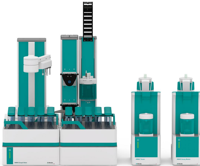
Abbildung 1. OMNIS Titrator mit einem OMNIS Dosiermodul und einem OMNIS Probenroboter S.