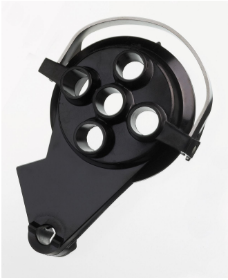
Titriergefäßoberteil mit 5 Öffnungen