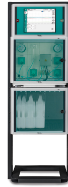
Abbildung 3. 2060 XRF Process Analyzer zur Analyse des CTZ-Gehalts in Weißbronzebädern.

Werkzeug zur Optimierung und Kontrolle des Galvanisierungsprozesses. Der Einsatz der Röntgenfluoreszenz erlaubt kontinuierliche Echtzeiteinblicke in die Badchemie, trägt zur Aufrechterhaltung der Abscheidequalität bei und senkt die Betriebskosten.