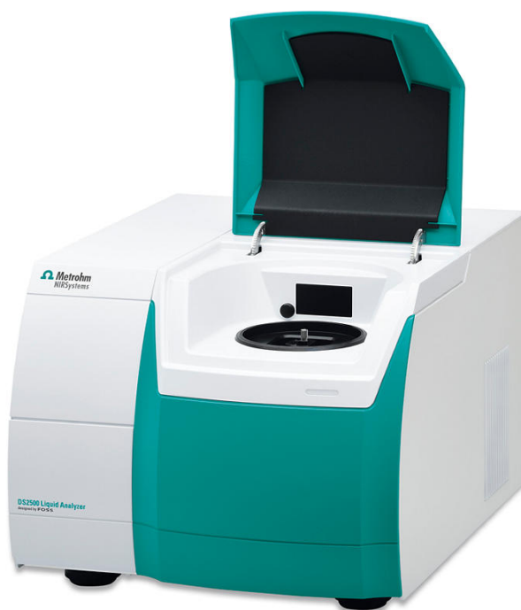
Abbildung 1. Metrohm DS2500 Flüssigkeitsanalysator zur Bestimmung der Research-Oktan­zahl (ROZ) in Isomeraten.