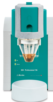
Abbildung 1. 884 Professional VA.

Die Probenvorbereitung und die Bestimmung von Iod erfolgt nach der USP-Monographie „Thyroid Tablets“. Das Verfahren umfasst die Trockenveraschung der Tabletten, wobei organisch gebundenes Iod freigesetzt und später in Iodat umgewandelt wird. Der Iodatgehalt wird mit dem 884 Professional VA ( Abbildung 1 ) mittels Differential-Puls-Polarographie bestimmt.