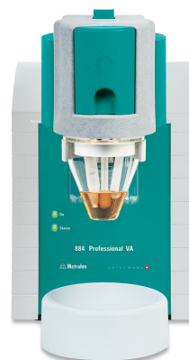
Abbildung 1. 884 Professional VA, manuelles Messsystem unter Verwendung der MME pro.

Die LFP-Probe wird eingewogen, mit entgaster verdünnter Schwefelsäure vermischt, 15 Minuten lang auf 85 °C erhitzt und danach abgekühlt. Anschließend wird die aufgeschlossene Probenlösung in das Messgefäß zugegeben, das bereits 20 mL entgasten Elektrolyten enthält. Die Quantifizierung erfolgt mittels zweier Standardzugaben mit separaten Fe(II)- und Fe(III)-Lösungen.