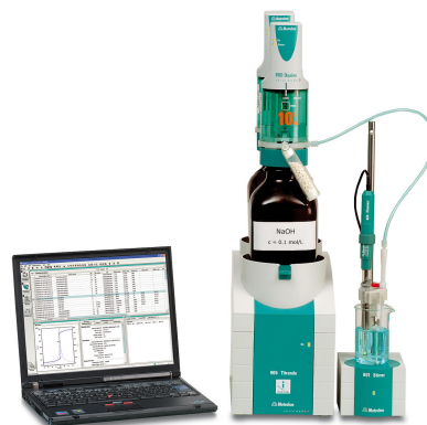
Abbildung 1. Titriersystem bestehend aus einem 905 Titrando, einem Stabrührer und einer Unitrode easyClean. Die Daten werden mit der Software tiamo erfasst und ausgewertet.

Eine geeignete Menge der Probe wird in einen Einwegbecher überführt und entionisiertes Wasser hinzugefügt. Die Lösung wird gerührt, um ein vollständiges Auflösen und Mischen zu gewährleisten. Anschließend wird die Lösung mit standardisierter Salzsäure titriert, bis der erste Äquivalenzpunkt erreicht ist.