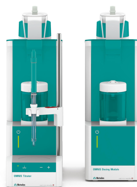
Abbildung 1. OMNIS-System bestehend aus einem OMNIS Advanced Titrator und einem OMNIS Dosiermodul, ausgestattet mit einer doppelten Pt-Draht-Elektrode zur Indikation.

Probe und Titrationslösungsmittel (bestehend aus Toluol, Methanol, Schwefelsäure und Eisessig) werden in ein thermostatisiertes Gefäß pipettiert. Unter Rühren wird die Lösung auf 0–5 °C abgekühlt. Nach Erreichen dieser Temperatur wird die Lösung mit eingestellter Bromlösung titriert, bis der Äquivalenzpunkt erreicht ist.