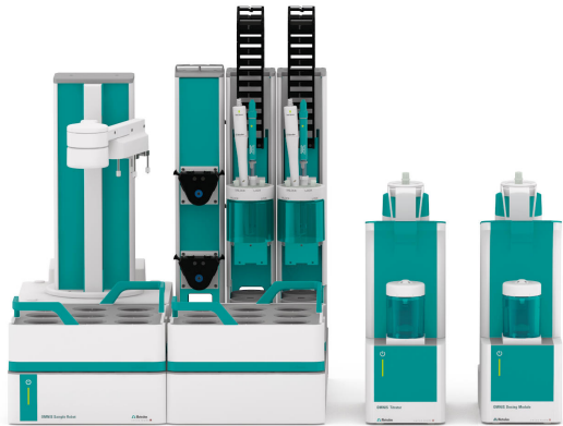
Abbildung 1. OMNIS Sample Robot S, OMNIS Dosing Module und OMNIS Advanced Titrator, ausgestattet mit dProfitrode und dAg-Titrode zur Bestimmung des Chloridgehalts.

Eine angemessene und repräsentative Menge der Probe wird mit Wasser versetzt. Der pH-Wert wird mit Salpetersäure auf unter pH 1,5 eingestellt. Die Probe wird mit standardisiertem Silbernitrat titriert, bis der Äquivalenzpunkt erreicht ist. Für die Tauchspülung von Elektroden und Büretten wird zunächst Wasser, dann Isopropanol verwendet. Danach werden die Elektroden vor der nächsten Probe eine Minute lang in Wasser konditioniert.