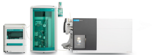
Abbildung 1. Instrumenteller Aufbau zur Messung von Halogenessigsäuren, Dalapon und Bromat, einschließlich eines 889 IC Sample Center – cool (Metrohm), 940 Professional IC Vario (Metrohm) und 6475 Triple Quadrupole LC/MS mit Jet Stream Technology Ion Source (Agilent). Ein Dosino wurde zur direkten Infusion in die MS während der Methodenoptimierung verwendet.

Die Kombination von HPLC mit Massenspektrometrie hat sich im Allgemeinen auf die Untersuchung organischer Moleküle konzentriert. Durch die Kopplung der Ionenchromatographie (IC) mit Massenspektrometrie (MS) wird es möglich, ionische und polare Substanzen hochempfindlich zu analysieren. Der Einsatz des 889 IC Sample Center – cool garantiert eine stabile und reproduzierbare Probenverarbeitung bei 4 °C (Abbildung 1), indem es den Zerfall der degradationsempfindlichen HAAs verhindert.