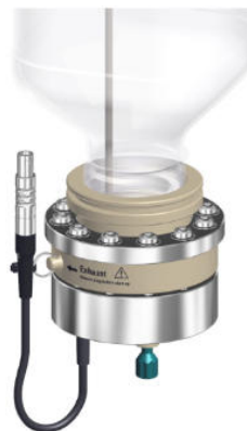
Abbildung 2. Das 948 Continuous IC Module, CEP, produziert automatisch den KOH-Eluent aus Reinstwasser und einem KOH-Konzentrat. Die elektrochemische Eluentenherstellung erfolgt an einer Membran im Eluenten-Produzenten-Kartusche.

Das 948 Continuous IC Module, CEP, erzeugt präzise einen Kaliumhydroxid-Eluenten in Konzentrationen von 15-100 mmol/l Kaliumhydroxid (KOH) ( Abbildung 2 ). Der IC wurde mit der Software MagIC Net gesteuert, während das MS mit der Software MassHunter betrieben wurde. Die Synchronisation beider Geräte wurde über ein Remote-Kabel gesteuert. Tabelle 1 listet die wichtigsten Geräteeinstellungen auf.