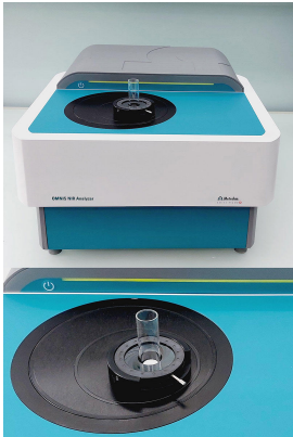
Abbildung 1. OMNIS NIR Analyzer Solid mit 15 mm Küvette und flexiblem Halter OMNIS NIR.

In dieser Studie wurden 17 Paracetamol-Tabletten mit unterschiedlicher Wasseraktivität (0,23-0,85 a_w ) mit einem OMNIS NIR Analyzer gemessen (Abbildung 1), um ein Vorhersagemodell für die Quantifizierung zu erstellen. Die Proben wurden im Reflexionsmodus (1000-2250 nm) in 15-mm-Vials unter Verwendung eines flexiblen Halters und einer Einzelpunktmessung gemessen. Die Referenzwerte wurden gemäß der USP<922> Wasseraktivität [3] gemessen.