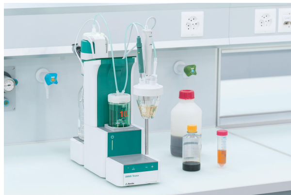
Abbildung 1. OMNIS Titrator-Setup für die thermometrische Titration und die mit der OMNIS-Software durchgeführte Datenauswertung.

Eine geeignete Menge der Probe wird genau in das Titrationsgefäß eingewogen. Durch Zugabe von entionisiertem Wasser wird die Probe gelöst und bis zum exothermen Endpunkt mit standardisiertem STPB titriert.