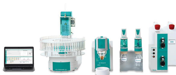
Abbildung 1. 884 Professional VA, vollautomatisch für VA-Analyse.

Die scTRACE Gold-Elektrode wird vor der ersten Bestimmung elektrochemisch aktiviert.