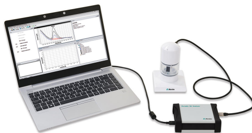
Abbildung 1. 946 Portable VA Analyzer (scTRACE Gold-Version)

Die scTRACE Gold-Elektrode wird vor der ersten Bestimmung elektrochemisch aktiviert. Im nächsten Schritt werden die Wasserprobe und der Grundelektrolyt in das Messgefäß pipettiert. Die Bestimmung von Selen(IV) erfolgt mit dem 884 Professional VA oder mit dem 946 Portable VA Analyzer unter Verwendung der in Tabelle 1 angegebenen Parameter. Die Konzentration wird durch zweimalige Zugabe einer Selen(IV)-Standardlösung bestimmt.